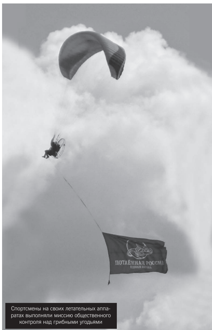
Спортсмены на своих летательных аппаратах выполняли миссию общественного контроля над грибными угодьями