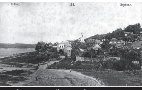
Дорога из города в Заречную слободу по мосту через Шохонку. 1910-е гг.

Дождички прошли, кой-где в леску колеи заплыли, а там дальше дорогу чинят, даве Миней сказывал.