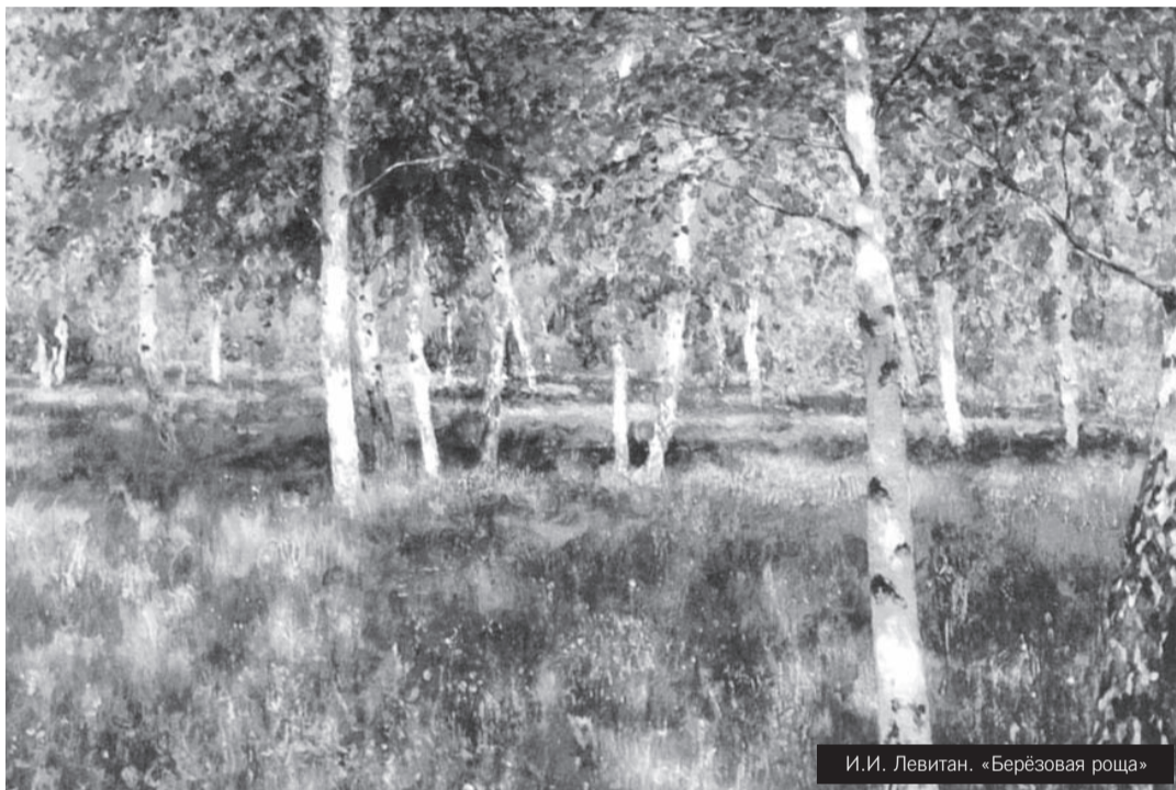
И.И. Левитан. «Берёзовая роща»

Пронёсшийся над Плёсом 12 июня ураган нанёс тяжелые увечья одной из главных достопримечательностей Плёса – Левитановской берёзовой роще. Накануне Пятого Левитановского фестиваля прозвучала инициатива помочь роще.