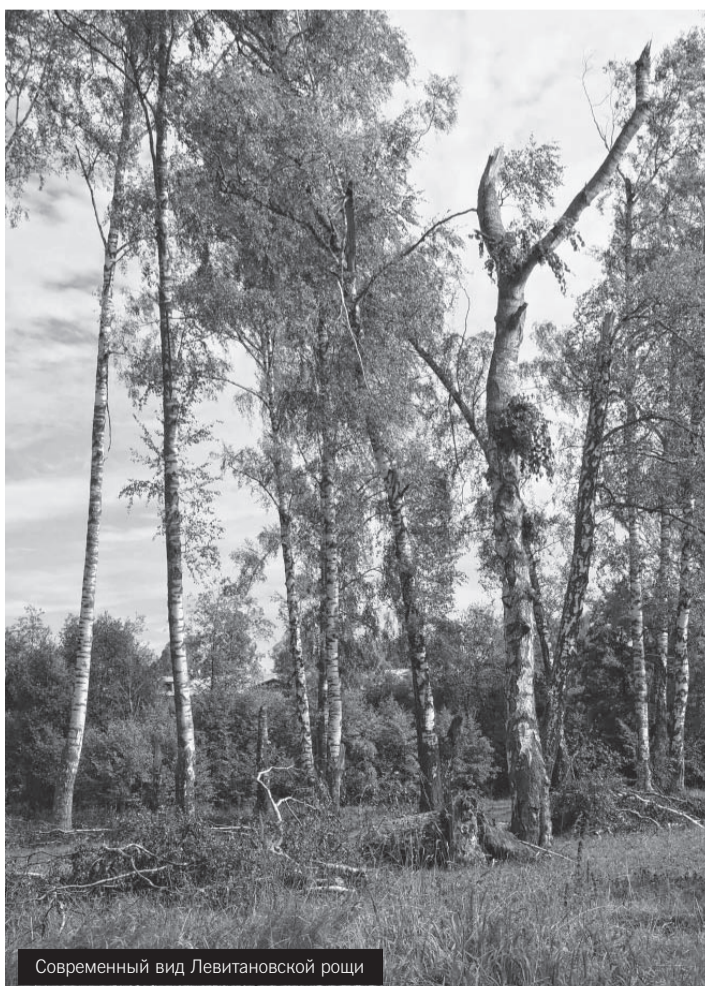
Современный вид Левитановской рощи