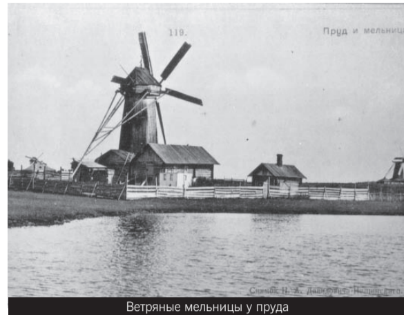
Ветряные мельницы у пруда

– Отлично, но кого же рукоположил он в иереи и во епископа? Тех же самых отлученных православной церк-