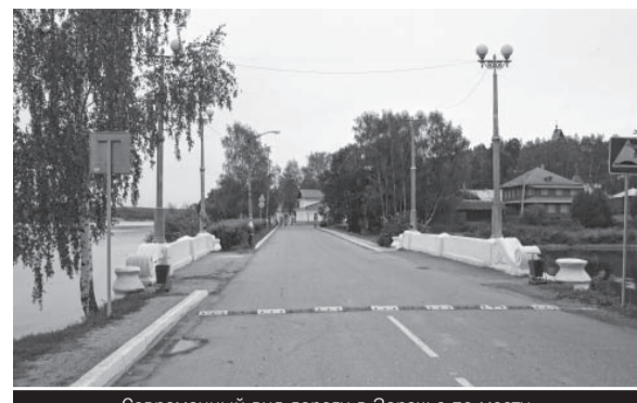
Современный вид дороги в Заречье по мосту через Шохонку

оттирать платком вспотевший лоб. – Ветерком обдувает, и солнышко не печет.