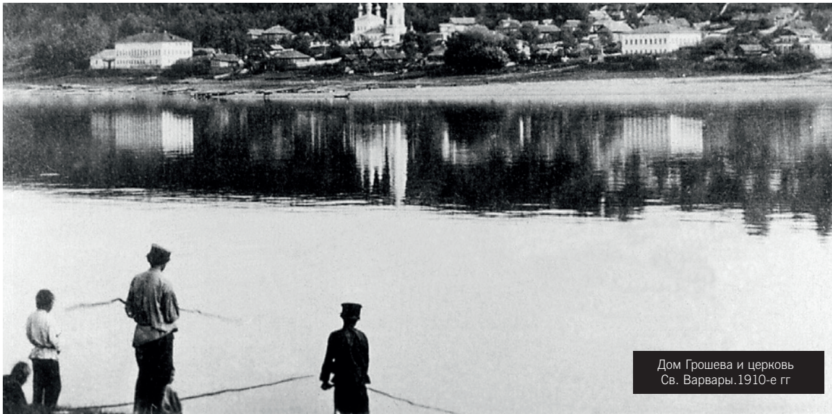
Дом Грошева и церковь Св. Варвары. 1910-е гг

Полушкина не вздрогнула, как утром в тарантасе, при