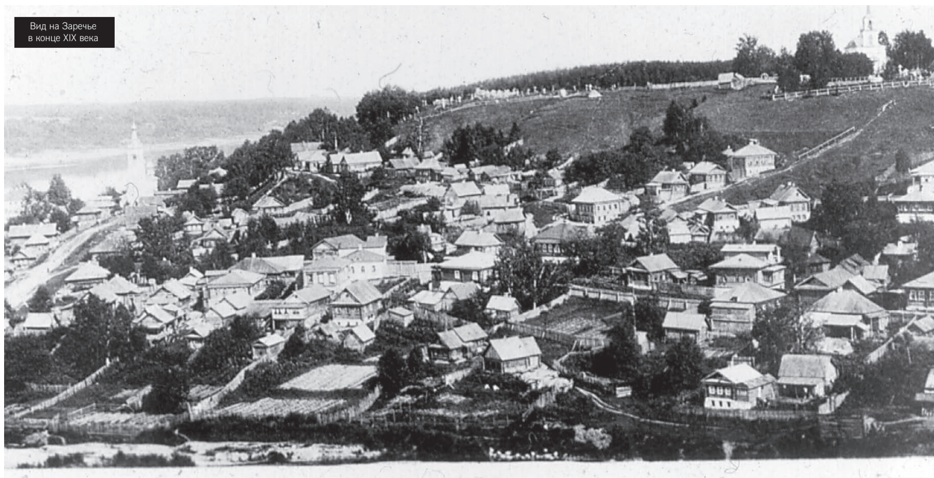
Вид на Заречье в конце XIX века

– Это вы, наша bonnevoisine ? 7 – проговорила Хрустальникова, тоже подбегая к окну, – что же вы стоите на солнце, входите к нам сюда.