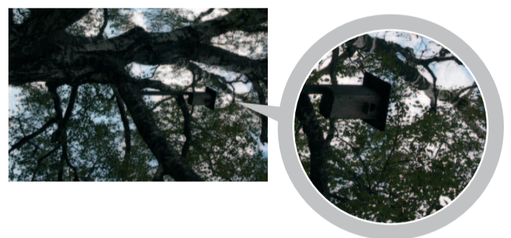
Засохшую старую берёзу спилят осенью, когда улетит семья скворцов.

дуб. Мне подумалось, что даже деревьям возраст изящества не добавляет. Осенью, как семейство скворцов покинет скворечник, берёзу спилят.