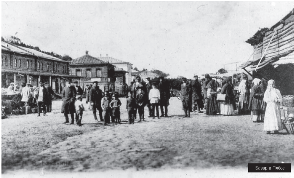
Базар в Плёсе

но сдерживала жёлтая лента в тон капота, на ногах были надеты жёлтые чувяки 2 из тонкой кожи.